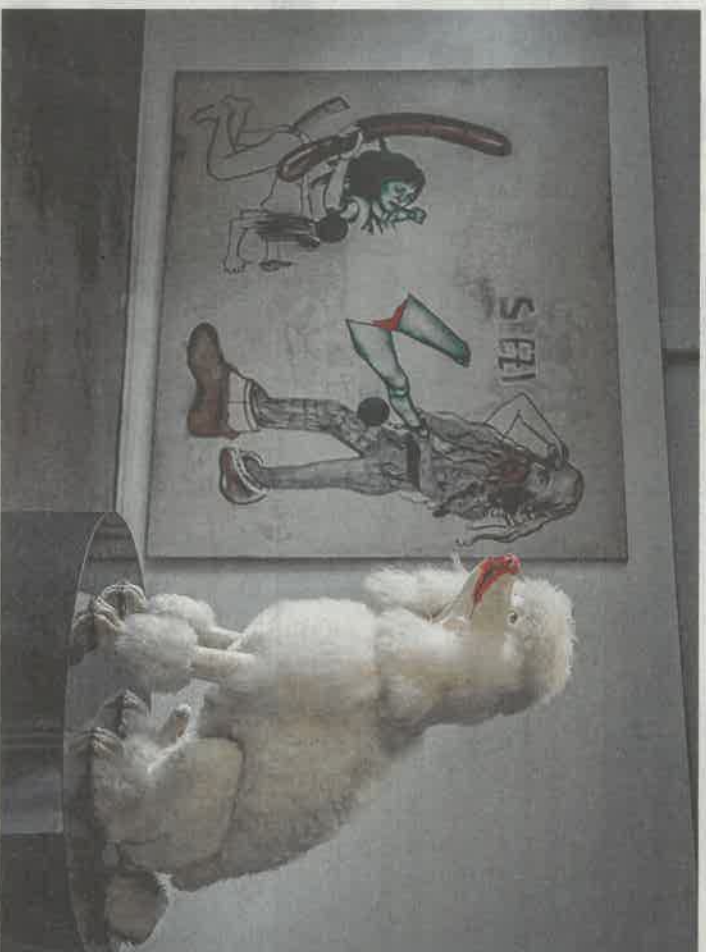
De poedel van Edward Lipksi voor een schilderij van Kati Heck.

En zo gaat het maar door. Of het nu de poedel van Lipski is of een van de bekende strandportretten van Rinke Dijkstra, deze expo is doortrongen van rock-'n-roll-zweet. Of beter nog: smells like punk spirit . En dat allemaal van